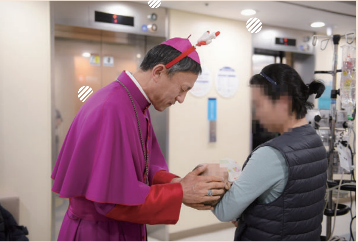
서울대병원 어린이병원을 찾아 기도를 하고 있는 유경춘 티모테오 주교

특히 이번 성탄은 서울대교구 사회사목국 병원사목위원회(위원장 김지형 제오르지오 신부) 산하 병원 원목실 및 가톨릭중앙의료원 사회사업실 등과 협력을 통해 한마음한몸운동본부 전 직원이 선물 나눔 봉사자로서 직접 아이들에게 선물을 전달해 더욱 뜻깊은 시간이 되었습니다.