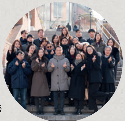
한마음한몸운동본부 임직원 일동

2020년에는 소식지가 반기에 한 번 발행되는 것으로 변경됩니다. 항상 소통하는 자세로 후원자님들과 이야기 나누는 한마음운동본부가 되도록 노력하겠습니다. 감사합니다.