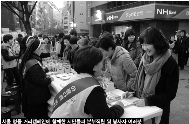
서울 명동 거리캠페인에 함께한 시민들과 본부직원 및 봉사자 여러분