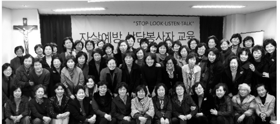
사진설명. 개소식을 앞두고 전문상담 교육을 받고 있는 센터 상담원

청소년들의 자살이 증가하고 있습니다. 통계청에 따르면 ▲2004년 248명 ▲2005년 279명 ▲2006년 232명 ▲2007년 309명으로 증가했으며 지난 2008년에 10~19살 자살자 수는 317명에 달했습니다. 청소년 상담소 등에는 "자살하고 싶다"며 고민을 털어놓는 아이들이 끊이지 않습니다. 가족, 친구들과의 갈등에서부터 학교 성적 비관, 이성과의 이별 등 그들을 옥죄고 있는 고민도 다양합니다. 그러나 청소년 자살은 조금만 관심을 기울이면 예방할 수 있다는 점에서 사회적인 관심이 절실히 필요하다고 전문가들은 지적합니다.