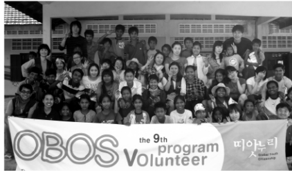
캄보디아 현지 청년과 어린이들과 띠앗누리 9기 일동

한마음한몸운동본부 국제청년자원활동 띠앗누리 9기는 지난 1월 6일(수) 1차 배움터를 시작으로 1월 27일(수)부터 2월 10일(수)까지