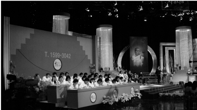
KBS 스튜디오 현장 - 이날 본부 장기기증상담원은 생방송 2시간 동안 1,110건의 장기기증 신청접수와 문의를 받았으며, 방송 이후로도 그 참여는 계속되었습니다.