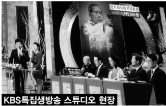
KBS특집생방송 스튜디오 현장

장기기증 신청 1,550명 동참, 장기이식대기자지원사업 후원(ARS) 1만5천여명 동참