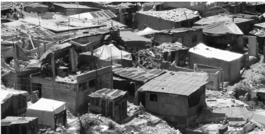
사진. 지난 2010년 1월, 절망적인 지진이 일어났던 그때 그 순간의 폐허 그대로인 아이티

지금부터 1년 전 카리브해의 가난한 섬나라 아이티는 규모 7.0의 강진으로 사상자 53만 명, 그리고 150만 명의 이재민이 발생하였습니다. 복구 노력은 지속되고 있지만 우리의 관심이 줄어들고 있는 사이 불행도 계속 되고 있습니다. 아직도 대부분의 이재민들은 자신들의 보금자리로 돌아가지 못하여 캠프촌 100여 군데에서 생활하고 있습니다. 지진으로 파괴된 건물들은 그대로 방치되어 있고, 젊은이들은 일자리를 찾지 못하고 방황하고 있으며, 지진으로 사랑하는 가족을 잃은 많은 사람들은 그날의 악몽