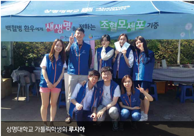
상명대학교 가톨릭학생회 루시아

한마음한몸운동본부는 지난 2010년부터 매년 서울대교구 대학생사목부 서울가톨릭대학생연합회 및 한국가톨릭대학생연합회와 함께 학생들이 스스로 자신들의 학교 캠퍼스에서 생명나눔운동인 조혈모세포기증 캠페인을 전개할 수 있도록 지원하고 있습니다. 올해는 6월 말 현재까지 상명대학교 '루시아'를 비롯한 전국 5개 대학 97명의 학생이 캠페인 봉사자로 참여하여, 총 940여 명에 이르는 젊은 학생들의 조혈모세포기증희망참여를 이끌었습니다.